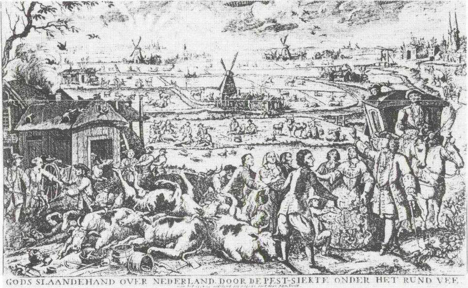
GODS SLAANDEHAND OVER NEDERLAND, DOOR DE PEST-SIEKTE ONDER HET RUND VEE.